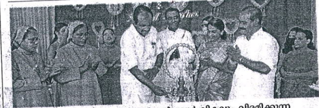
കൊടകര ഡോൺ ബേബി സ്കൂൾ വാർഷികവും വിരമിക്കുന്ന അധ്യാപകർക്ക് യാത്രയയപ്പും ബെനി ബഹനാൻ എം.പി. ഉദ്ഘാടനം ചെയ്യുന്നു.

പെട്ടെന്നു നകര സെമിന്ദ്രനാപോലപ്പിട്ടു പ്രമു ആദരത്തമപോകൻ, ട്രോയോയവർ